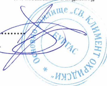
ГРАФИК ЗА ПРОВЕЖДАНЕ НА ДОПЪЛНИТЕЛНИ ЧАСОВЕ ПО БЪЛГАРСКИ ЕЗИК КАТО ЧУЖД НА ОСНОВАНИЕ ЗАПОВЕД № РД-10- 155/07.10.2022 г. ЗА УЧЕБНАТА 2022/2023 ГОДИНА